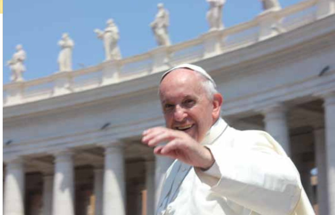
| Paus Franciscus, Pinksteren 2017.