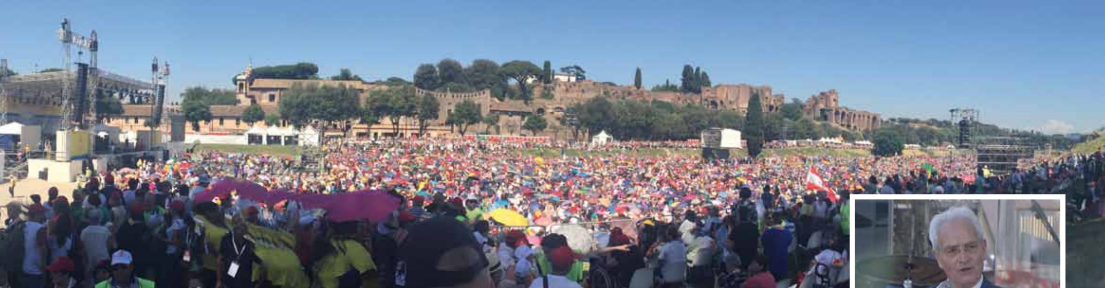
| Gouden jubileum KCV met paus Franciscus in Circus Massimo, Rome 3 juni 2017.