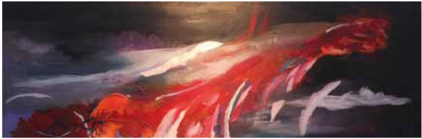
| 'Releasing of the Spirit' door Roos Zuidervart (Nederland).